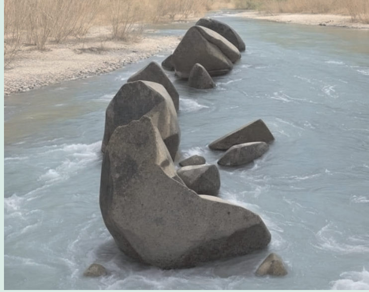
This is an amazing 'illusion' It looks like a person reading, while 'sitting' on the water surface but it's just 'Stones' in the river.

अशी हि अखंड हिंदुस्थान ची भावना ज्यांना संपूर्ण देशात रुजवायची होती ती सुरवात त्यांनी अंदमानच्या करावासातून केली आणि मृत्युंजय होऊन त्या नरकातून बाहेर पडल्यावर हिंदुमहासभेचे नेतृत्व करताना आणखी उत्कटतेने केली. अश्या अखंड हिंदुराष्ट्राचे स्वप्न बघणाऱ्या आणि जनतेला दाखवणाऱ्या राष्ट्रनायक आणि आमच्या हृदयातील भारतरत्न स्वातंत्रवीर विनायक दामोदर सावरकर यांस कोटी कोटी वंदन करून येथेच विरमते.